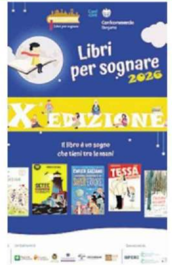
La locandina dell'edizione 2026 La premiazione il 28 maggio