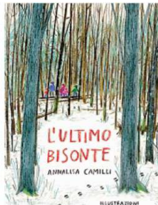
Il libro tema dell'incontro online