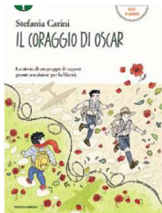
Il libro selezionato