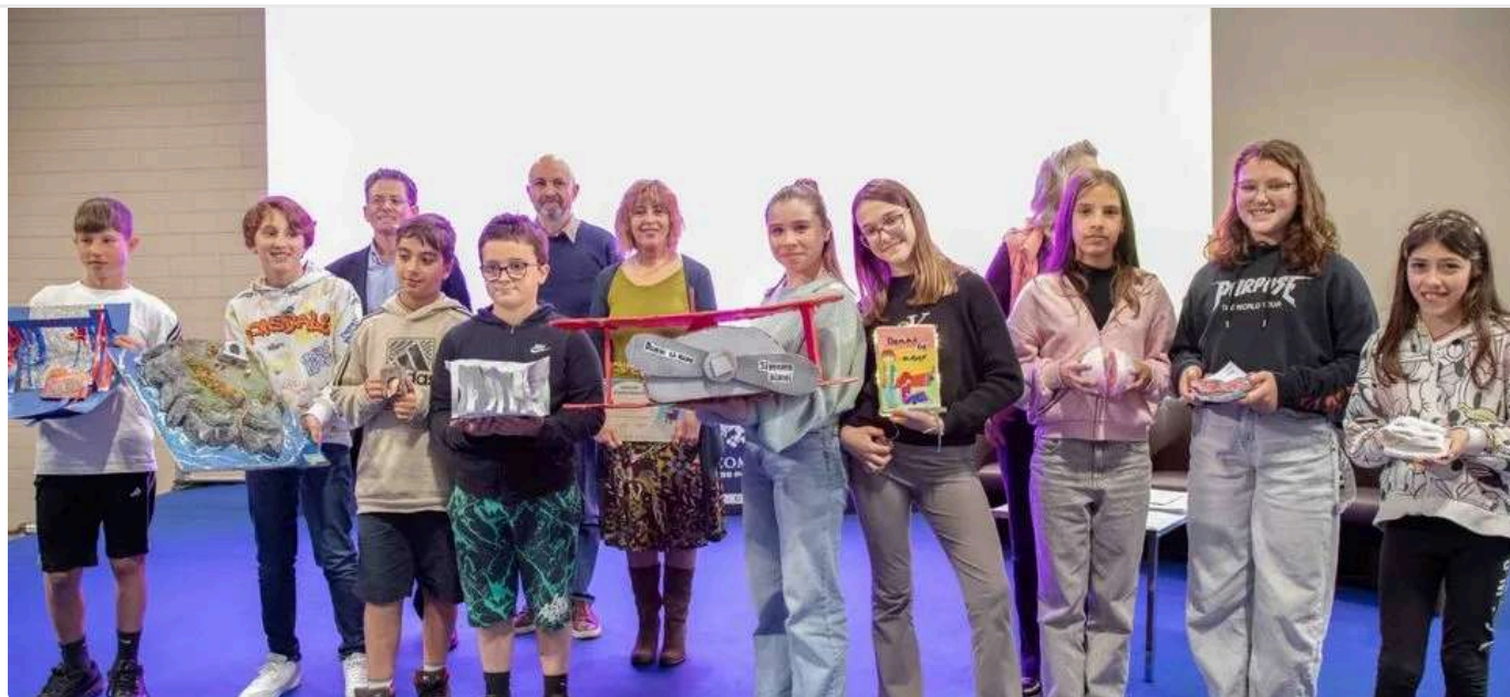
L'edizione 2025 di «Libri per sognare»