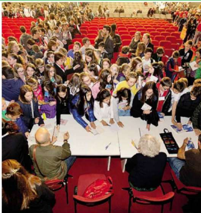
L'incontro gioioso di lettori e autori in una delle scorse edizioni