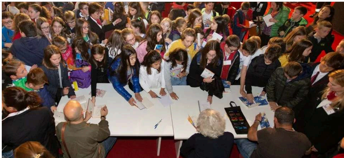
L'incontro con gli autori in una delle scorse edizioni di Libri per Sognare