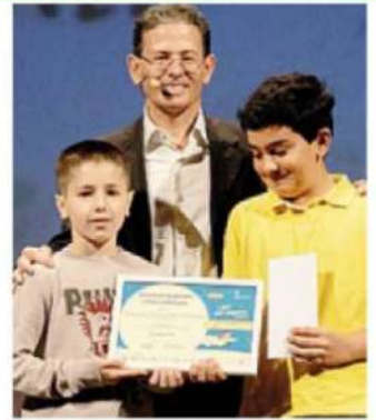
La premiazione di due alunni FRAU